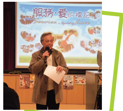
天主教四旬期運動籌備委員會舉辦了2012年度四旬期運動推介會

香港明愛協助委員會舉辦「四旬期愛心學校獎勵計劃」，共有93間天主教學校及幼稚園合共126,000人次參與。在繪畫、填色及心聲網誌創作比賽中勝出者已在2012年5月獲頒發獎項。