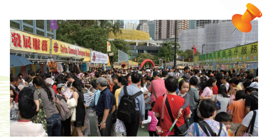
■ 六區賣物會各具特色，共吸引逾100,000人入場，參與善舉