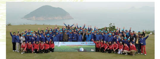
■ 百多名球手參與慈善高球日，發揮「以愛服務締造希望」的精神