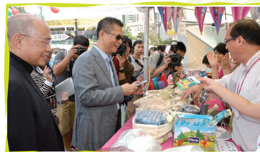
■ 陳茂波局長與一眾嘉賓參觀設於維多利亞公園的賣物會攤位

工銀亞洲已連續14年擔任籌款委員會主席。本年度籌款總收入創新高，錄得2,872萬元佳績；這款項包括六區賣物會籌得的710萬元、銷售慈善抽獎券的1,241萬元、以及「明愛之友」(透過舉辦籌款活動如「明愛暖萬心」慈善晚會、新春慈善步行及慈善高球日)、籌委會贊助人、團體以及個別善長慷慨捐助合共的921萬元。