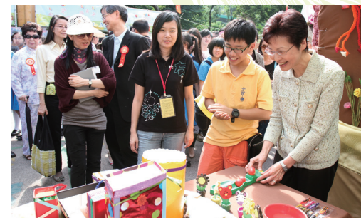
■ 林鄭月娥司長於花墟公園參與攤位遊戲