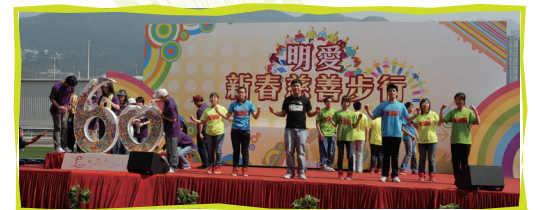
■ 明愛新春慈善步行啟動禮 — 萬眾一心、全情投入表演，同賀明愛鑽禧紀念